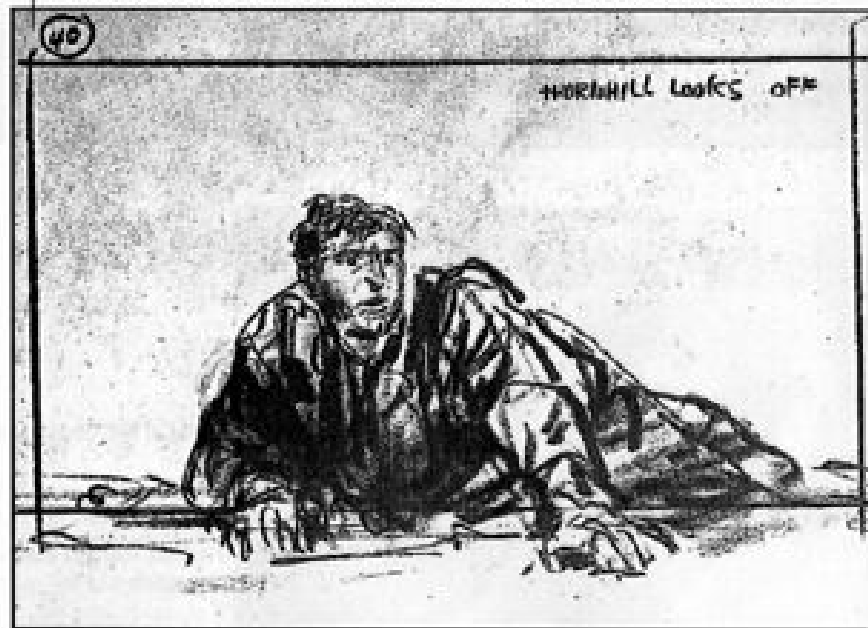
Faux story-board dessiné plus tard pour les besoins de la promotion du film.